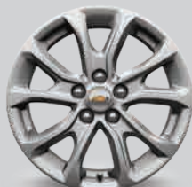
Rines de aluminio de 18"